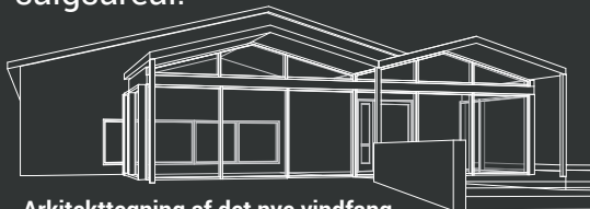
Arkitekttegning af det nye vindfang

Nyt og større vindfang med bedre "kunde-velkomst" + en anelse mere salgsareal.