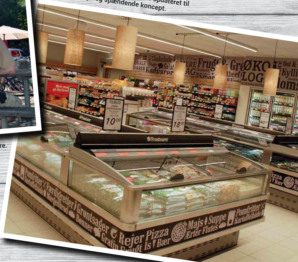
Byens egen butik bliver i løbet af 2016 opdateret til Dagli'Brugsens nye og spændende koncept.