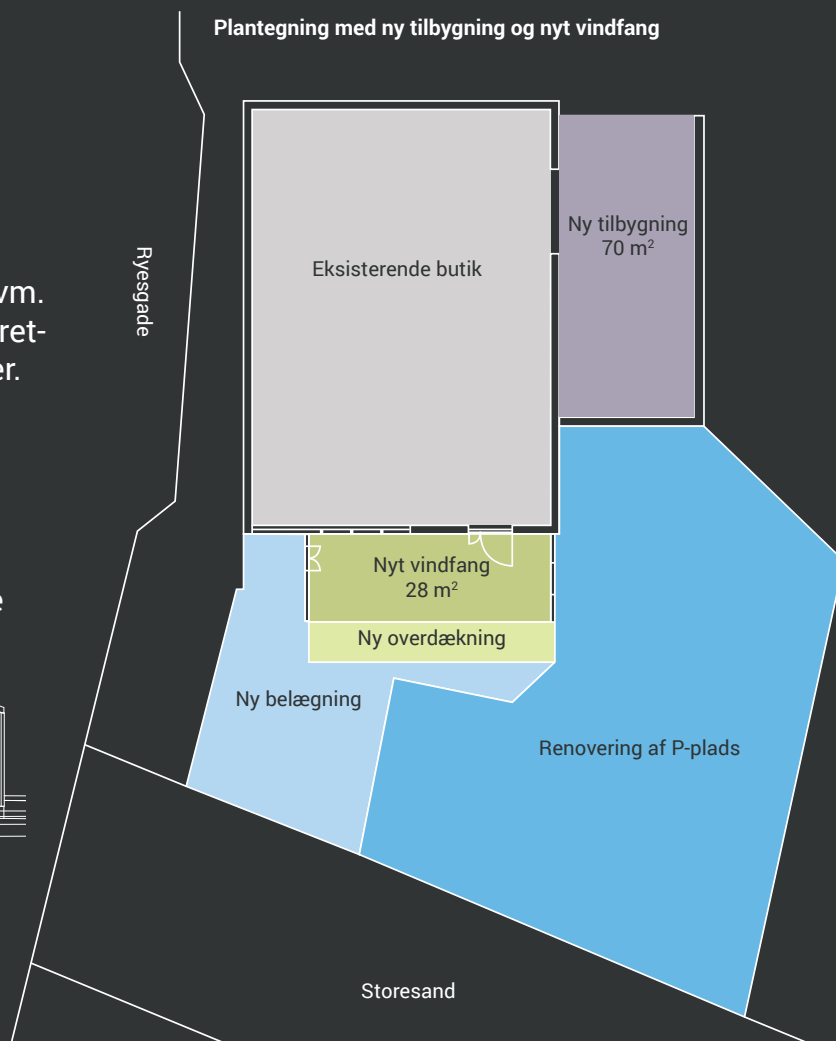
Plantegning med ny tilbygning og nyt vindfang

Tilbygning ELLER nyt vindfang. Det, som bestyrelsen ikke vælger i Etape 2.